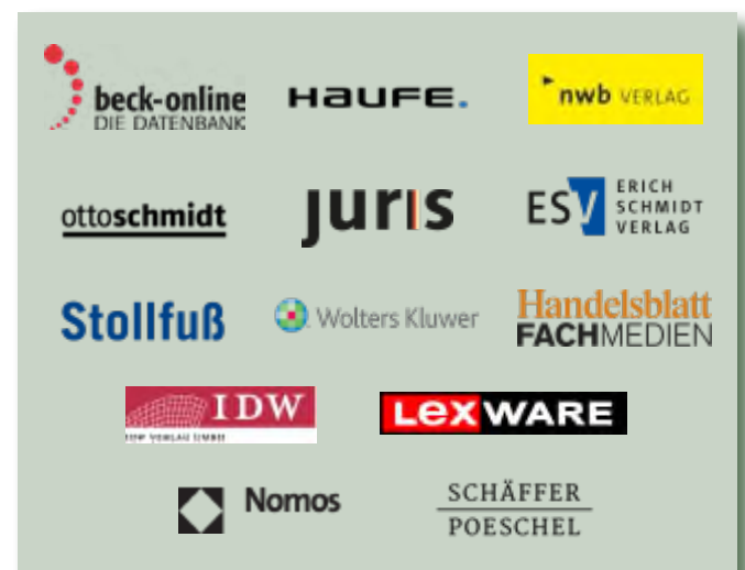
Auszug aus unserem Datenbank-Portfolio

„meine-medienverwaltung.de“ hilft beim täglichen Prozess der Recherche, Beschaffung und Verwaltung Ihrer Fachinformationen.